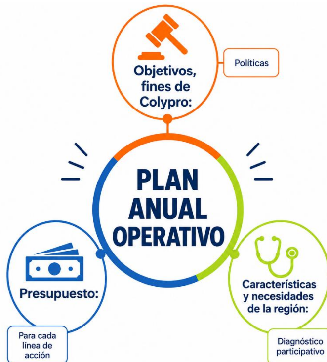
Figura 4. Plan de trabajo

El plan de trabajo regional se elabora anualmente en alineación con el Plan de Desarrollo Institucional y el Plan Anual Operativo (PAO) de Colypro. Su elaboración parte del análisis de las necesidades de las personas colegiadas de la región, a partir del cual se definen objetivos, acciones y actividades organizadas por líneas de acción, con sus respectivos responsables y mecanismos de seguimiento. Asimismo, en la Asamblea Nacional se aprueba cada año el presupuesto asignado a la región para la ejecución de dichas actividades. El cumplimiento del plan se monitorea mediante informes periódicos que permiten evaluar el avance de las metas establecidas.