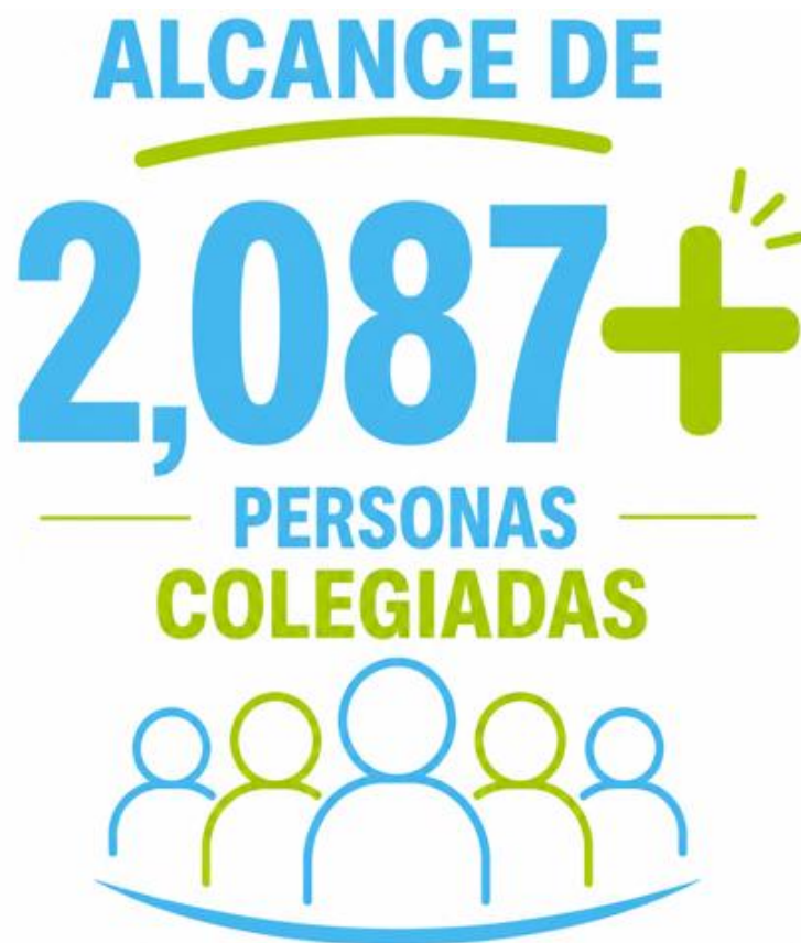
Figura 6. Alcance de personas colegiadas

Según los datos presentados en las tablas, muestra que; durante el período 2025-2026, las personas colegiadas de Guácimo, Pococí y Sarapiquí encontraron espacios para aprender, compartir experiencias, fortalecer sus competencias profesionales y participar activamente en las actividades regionales. Cada participación representa una oportunidad de crecimiento y un vínculo fortalecido con nuestra comunidad profesional, evidenciando una variabilidad de temáticas y una participación que alcanza aproximadamente 2,087 personas colegiadas.