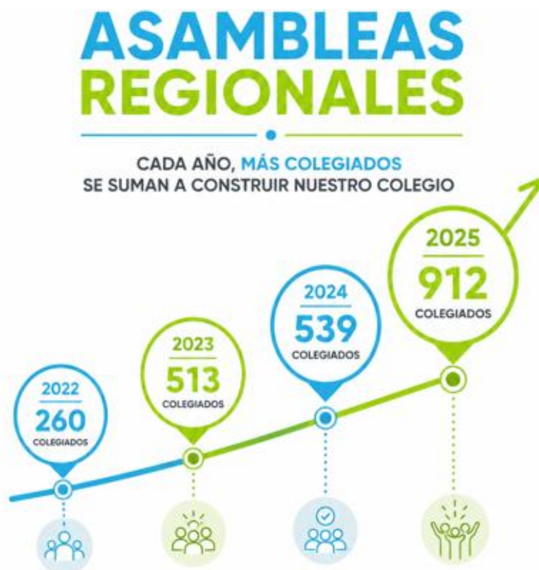
Figura 8: Participación de colegiados en las últimas asambleas regionales