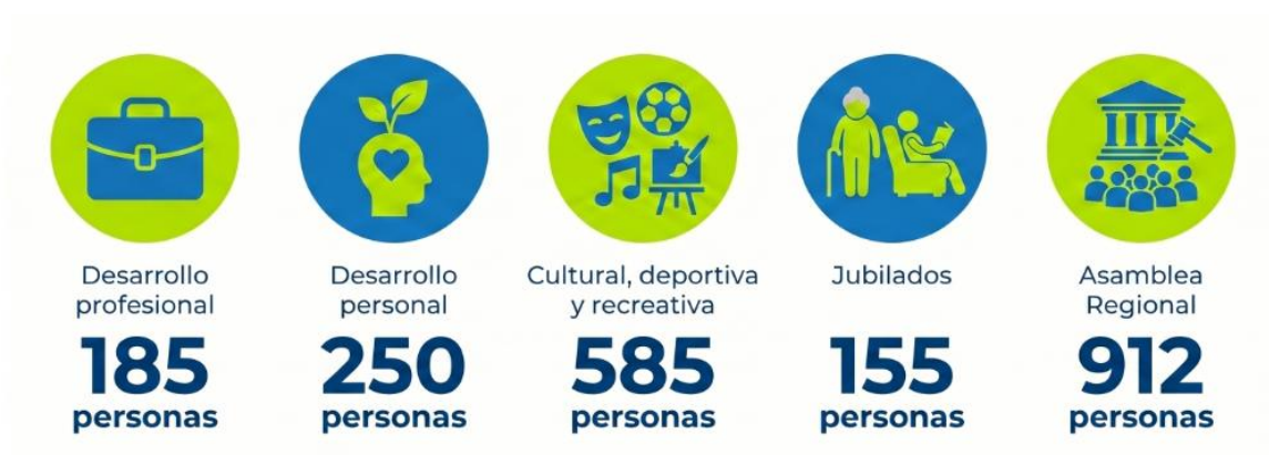
Figura 7: Participación de personas colegiadas por línea de acción la Junta Regional de Guápiles 2025-2026

Fuente: Elaboración propia a partir de los registros de participación de la Junta Regional de Guápiles, período 2025-2026.