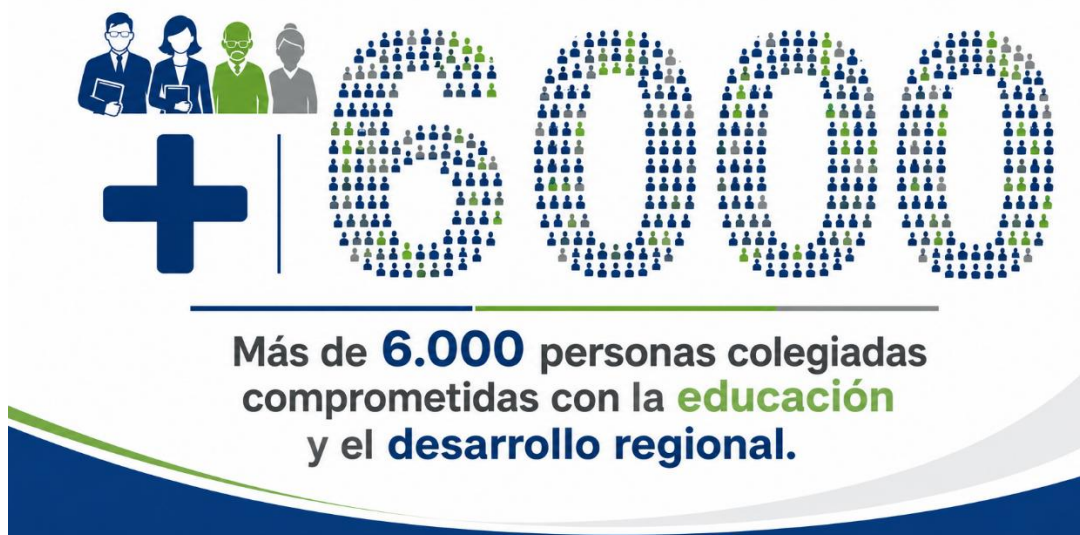
Figura 1. Cantidad de colegiados de la región 2026

Nuestra región está integrada por profesionales colegiados de los cantones de Guácimo, Pococí y Sarapiquí, mujeres y hombres comprometidos con la noble misión de educar y transformar vidas a través del conocimiento. Su labor cotidiana contribuye al desarrollo integral de nuestras comunidades, impulsando oportunidades, construyendo sueños y fortaleciendo el tejido social de la región.