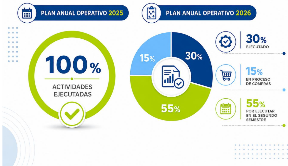
Figura 8: Ejecución presupuestaria

En cuanto al Plan Anual Operativo 2026, a la fecha se ha ejecutado el 30 % de las actividades programadas, mientras que el 15 % se encuentra en proceso de contratación o adquisición. Asimismo, las actividades restantes cuentan con la planificación y organización necesarias para su ejecución durante el segundo semestre de 2026, lo que permitirá alcanzar los objetivos establecidos para el período.