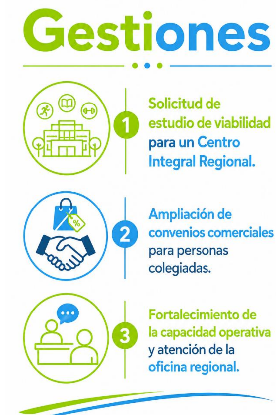
Figura 9. Acciones realizadas