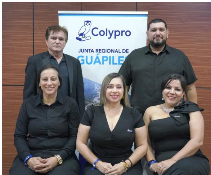
Figura 2. Miembros de la Junta Regional Colypro Guápiles

Somos colegiados de esta región, comprometidos con el fortalecimiento y desarrollo de nuestra comunidad profesional. Nuestro propósito es impulsar acciones que permitan acercar los beneficios institucionales a la región, promover oportunidades de capacitación y actualización profesional, así como fomentar espacios de integración, recreación y convivencia entre los colegiados, representando los cantones de Sarapiquí, Pococí y Guácimo.