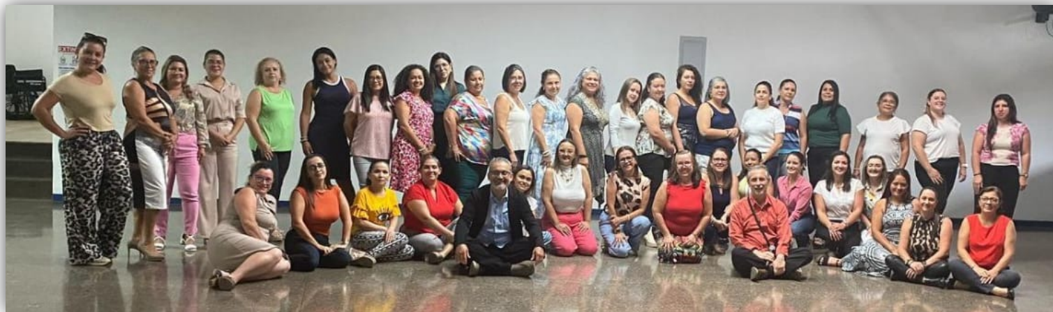
I Encuentro de Educadores: El docente: agente transformador de la sociedad. Realizado el 25 de abril de 2025

OpenAI. (2025). ChatGPT (versión del 23 de junio) [Modelo de lenguaje grande]. https://chat.openai.com/chat