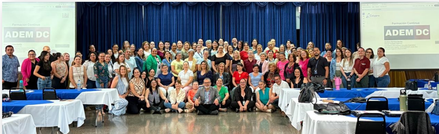
II Encuentro Regional para educadores. Creciendo e invirtiendo. Realizado el 13 de junio 2025

Que nunca nos falte la humildad para reconocer al otro y el corazón abierto para decir: gracias.