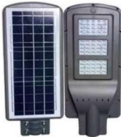
Imagen 4. Lámparas solares