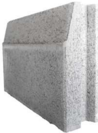
Imagen 3. Referencia de tipo de bordillos de concreto a utilizar para separar áreas verdes a aceras del parqueo.