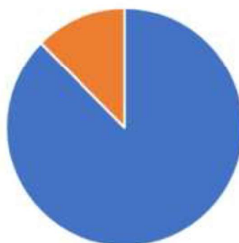
19 Protagonismo de colegiados

20 21 22 23 24 25 26 27 28 ■ Participación colegiados 80% ■ No colegiados 20%